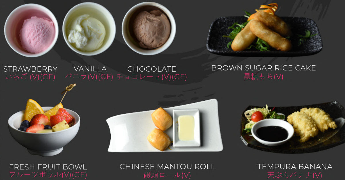
STRAWBERRY いちご (V)(GF)