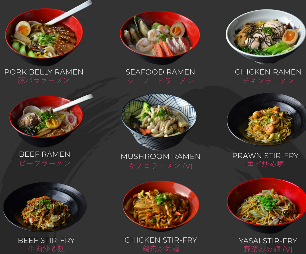
PORK BELLY RAMEN 豚バララーメン

All noodles are available as udon or ramen.