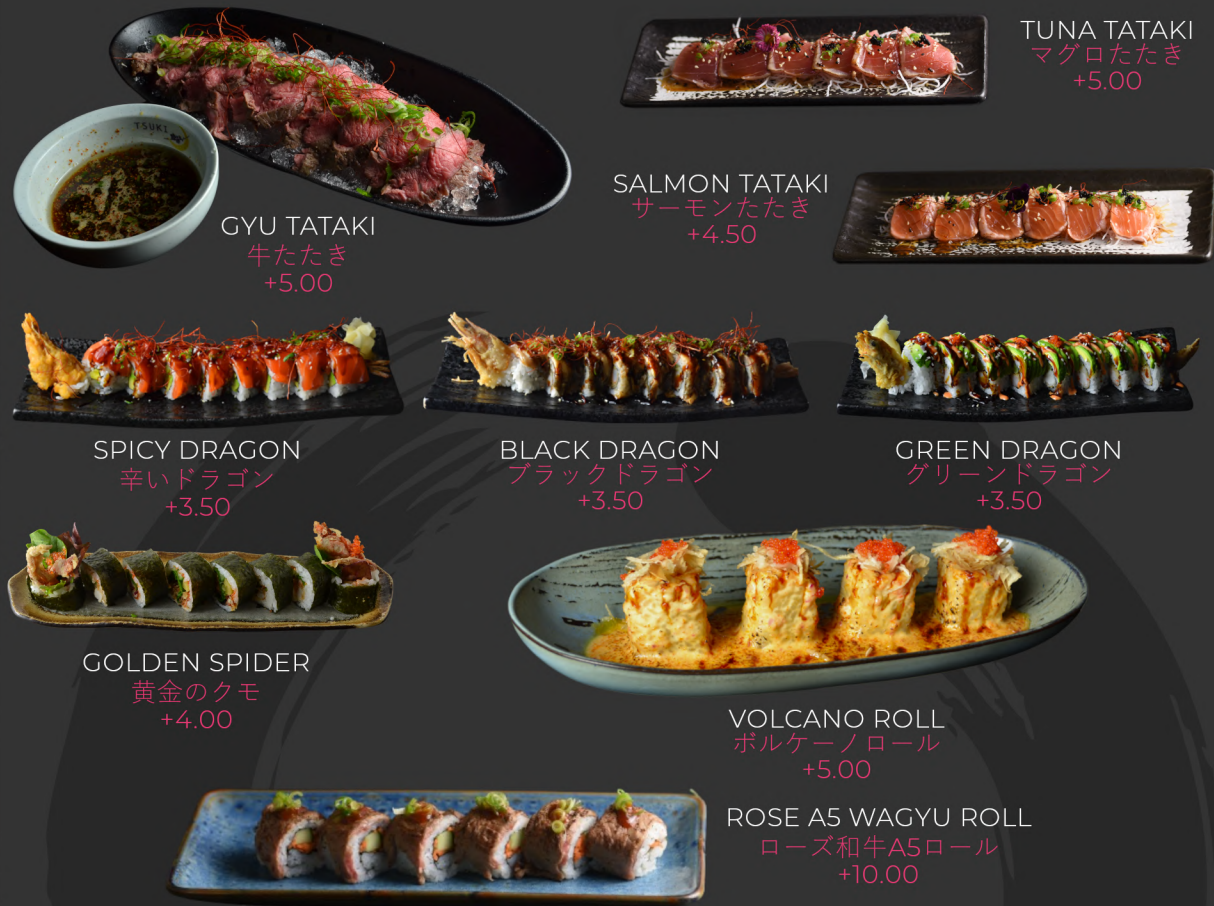
TUNA TATAKI マグロたたき +5.00