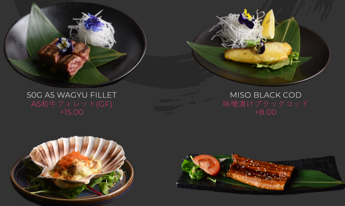
50G A5 WAGYU FILLET A5和牛フィレット(GF) +15.00